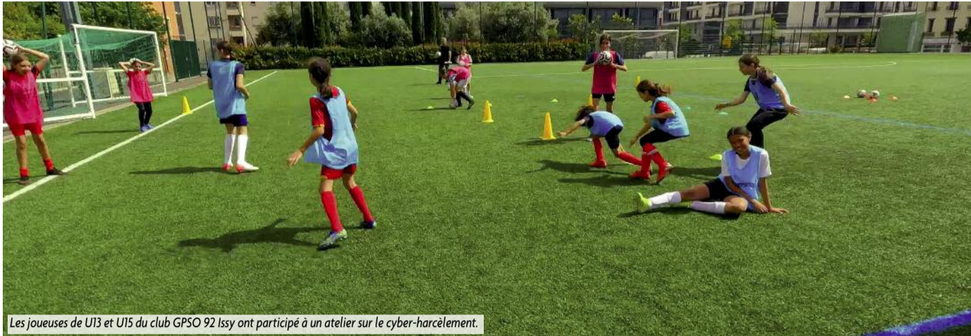
Les joueuses de U13 et U15 du club GPSO 92 Issy ont participé à un atelier sur le cyber-harcèlement.

La 1 re édition du Festival #Vivalssy a été l'occasion de proposer aux jeunes footballeuses du club GPSO 92 Issy une sensibilisation contre le cyber-harcèlement, animée par des équipes d'Orange.